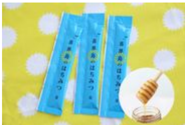
数量限定で喜界島のはちみつをプレゼント