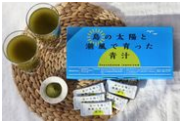
島の太陽と潮風で育った青汁(1)