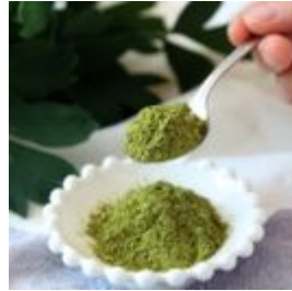
青汁粉末は溶けやすい顆粒加工