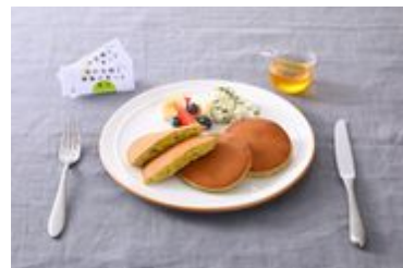
アレンジレシピ はちみつ豆乳パンケーキ