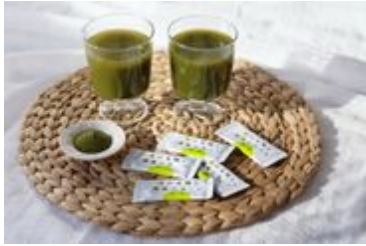
島の太陽と潮風で育った青汁(3)