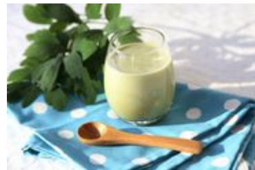
アレンジレシピ 青汁はちみつラテ