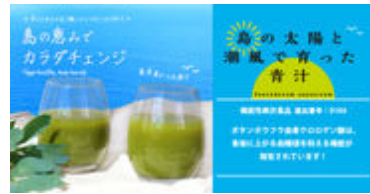
島の太陽と潮風で育った青汁(2)