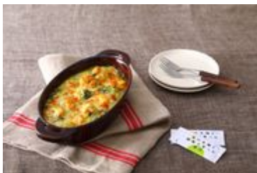
アレンジレシピ 里芋とえびとほうれん草グラタン