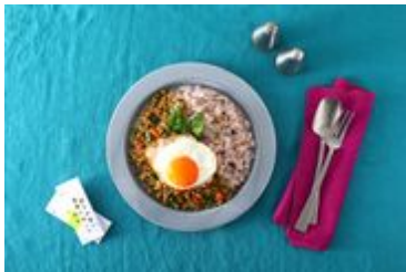
アレンジレシピ ガパオライス