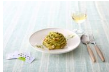
アレンジレシピ アボカドカルボナーラ